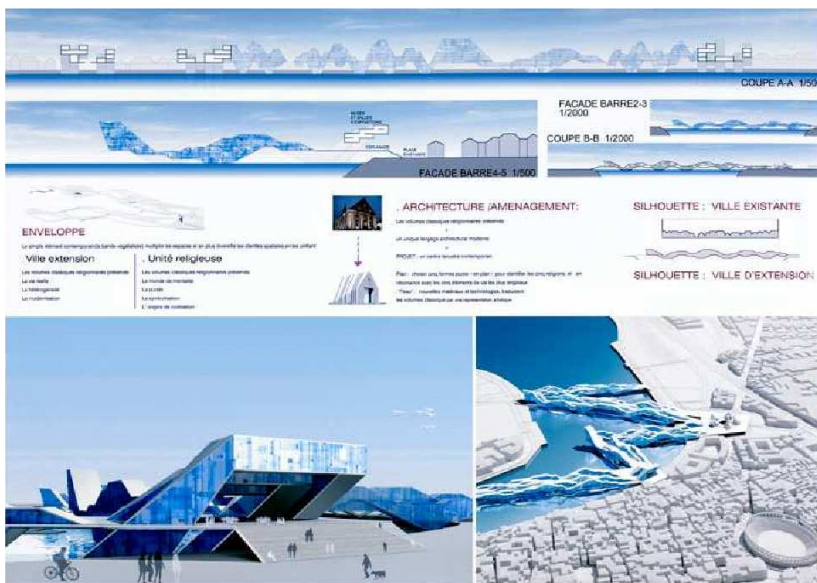
LIU RuiFeng Troisième Prix