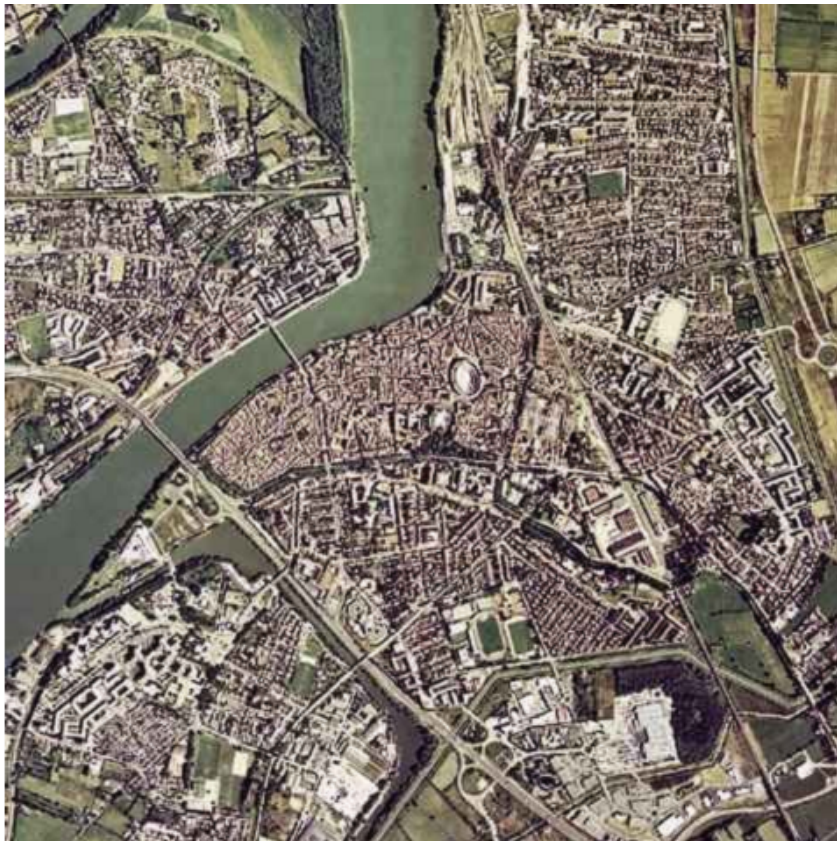
Vue aérienne de la ville d'Arles

"Le Nouvel Etablissement Humain – Application sur la ville d'Arles"