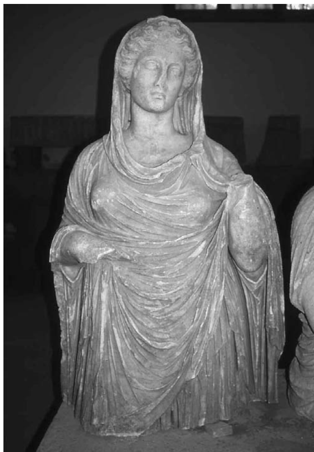
Cyrène. Musée. Statue funéraire iconique.

ter et sa fille Coré. Mais on trouve bien d'autres figures, plus d'une dizaine, qui ne sont jamais nommées car chacun pouvait les reconnaître. L'union de l'élément grec et de l'élément libyque est frappante. Elle se retrouve dans la grande série des demi-statues de la divinité féminine funéraire qui jaillit du sol en faisant le geste de se dévoiler. Il existe une série aniconique, fidèle à un tabou libyque sur l'interdiction de la représentation des traits de la déesse. Parallèlement, nous avons une série iconique, où les traits de la déesse figurent, sous l'allure mélancolique et compatissante qui