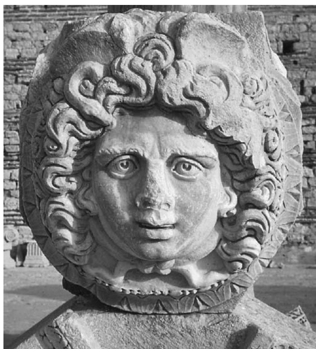
Leptis Magna. Tête de méduse du forum sévérien.

visibles, aussi bien sur les lieux qu'à travers les œuvres conservées au musée de Tripoli. Il y a d'abord les haut-reliefs qui décoraient l'attique de l'arc sévérien, et qui figurent la puissance de l'empereur chef de guerre, le prestige de l'empereur triomphateur, l'union de la famille impériale autour des dieux protecteurs de la ville de Leptis Magna, mais sous le patronage de la déesse Rome, l'empereur sacrificeur et intercesseur entre les hommes et les dieux. Il ne faut pas chercher dans ces reliefs des scènes réelles, mais bien plutôt des représentations symboliques. Sur le forum sévérien, ou nouveau forum, des têtes de Gorgones décoraient les retombées des arcades et constituent une remarquable série de plus d'une centaine d'exemplaires. Il faut ajouter des extraordinaires pilastres qui décorent depuis dix-huit siècles les absides de la basilique judiciaire,