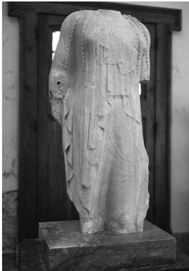
Cyrène. Musée. Koré du type des Korés de l'Acropole d'Athènes.