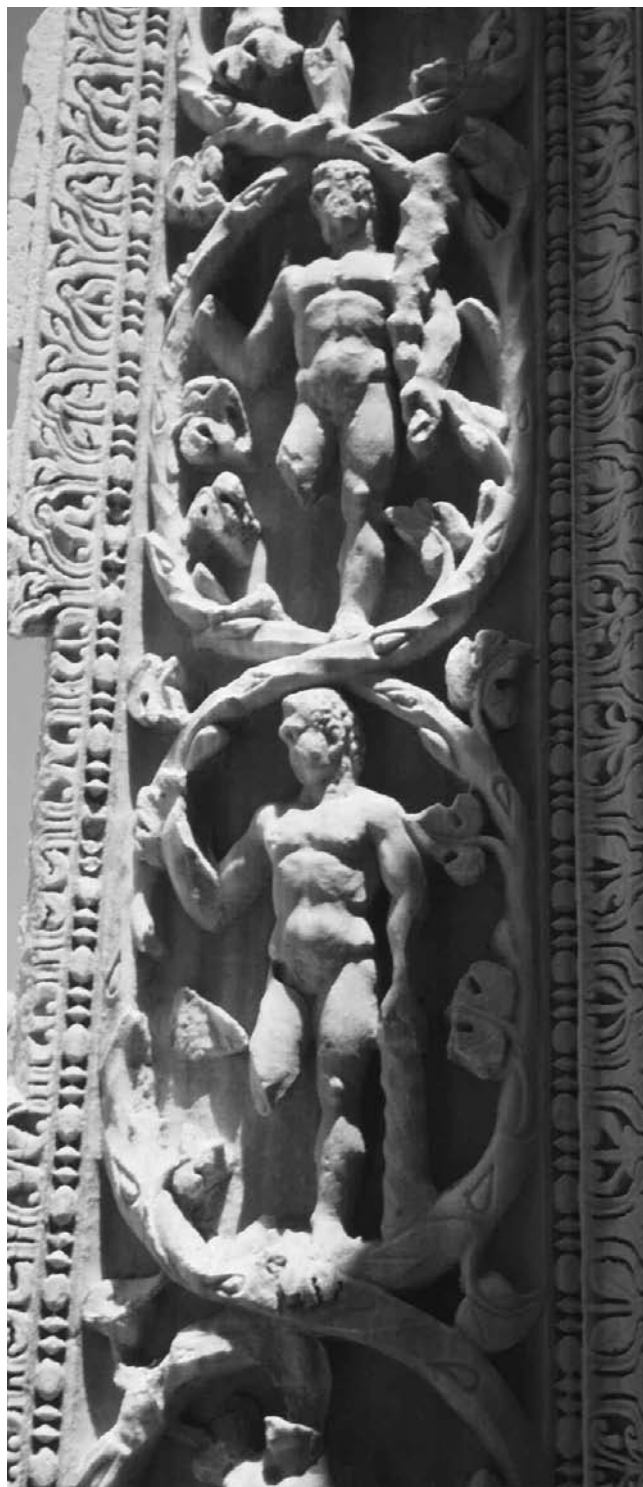
Leptis Magna. Basilique judiciaire. Pilastre à motifs héracléens (époque sévérienne).