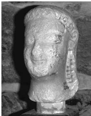
Cyrène. Musée. Tête de kouros archaïque.