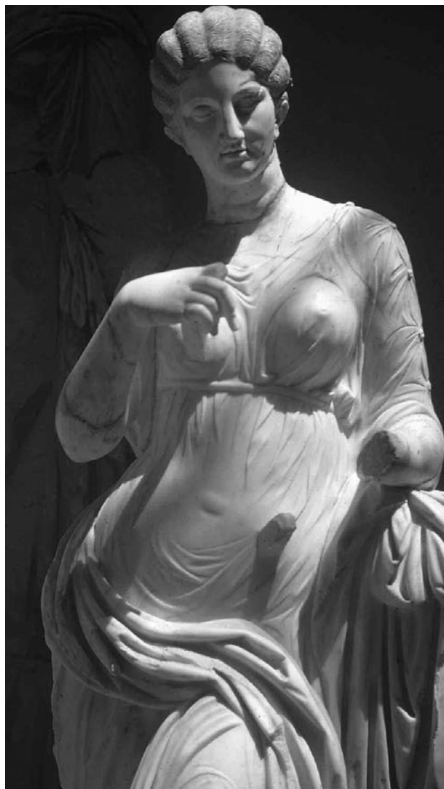
Cyrène. Musée. Clio, de la série des muses de l'Odéon (époque hadriannique).

trois villes, Sabratha, Oea (l'actuelle Tripoli) et Leptis Magna, c'est cette dernière qui fut la plus brillante et qui reste la mieux conservée. Comme Sabratha, Leptis Magna fut d'abord une cité libre, puis les deux villes devinrent municipales, ce qui signifie que des magistrats devenaient automatiquement citoyens romains, sans parler des concessions individuelles de la cité romaine à des notabilités. Le degré suivant était l'élévation au rang de colonie, ce qui ne signifie pas l'arrivée de colons en provenance de l'Italie, mais l'attribution de la cité romaine à tous les hommes libres. De plus, Septime Sévère accorda à Leptis Magna, sa ville natale, le jus italicum , ce qui assimi-