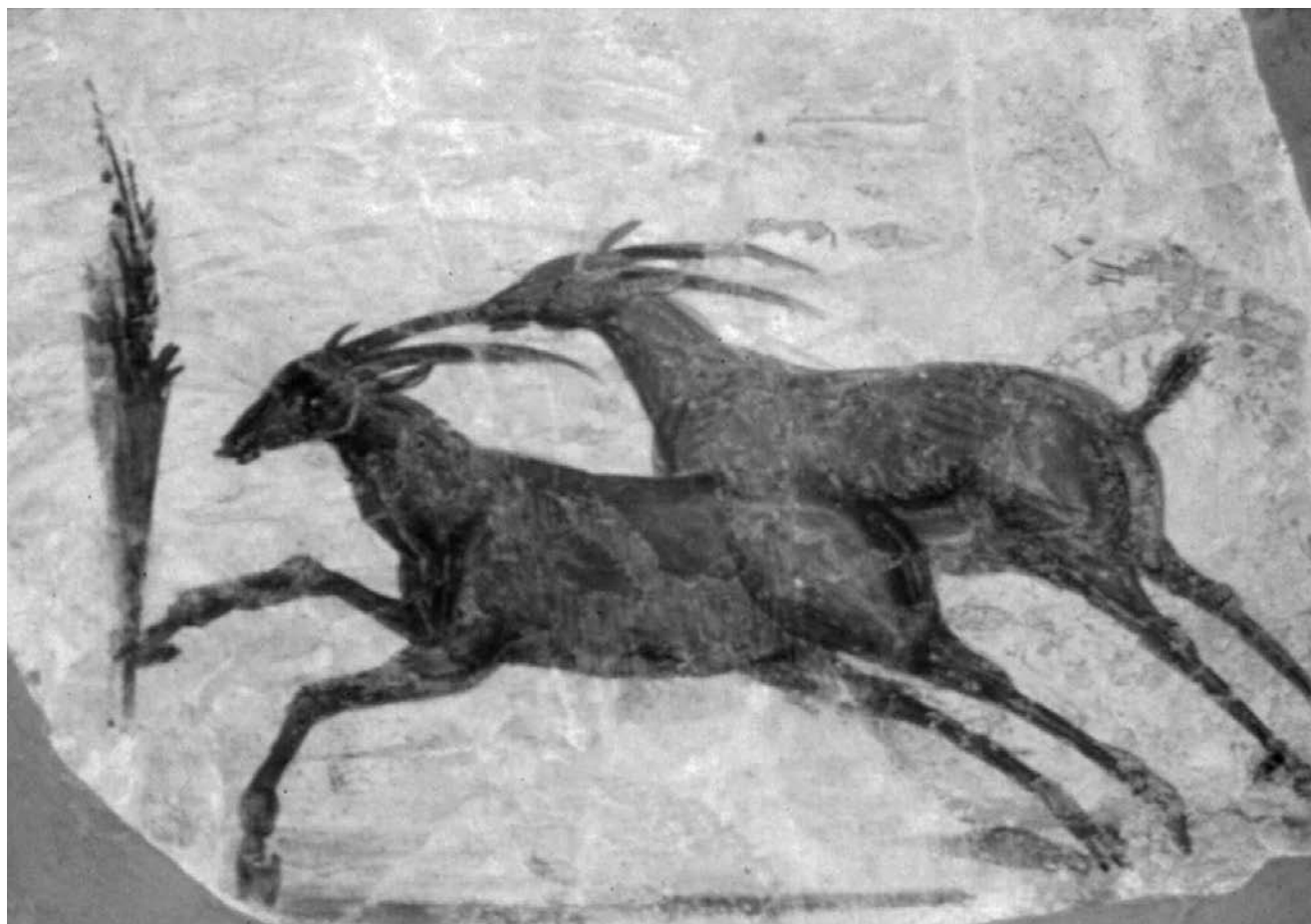
Tripoli. Musée. Fresque des gazelles (provient de la villa de dar Buc Amméra).

et qui figurent des motifs dionysiaques et héracléens, toujours par référence aux dieux ancestraux de la ville. Ici, la richesse décorative et la diversité des scènes se combinent dans un ensemble foisonnant mais d'un goût caractéristique des provinces de l'Afrique et de l'Asie au début du III e siècle. De la même période datent les peintures des thermes de la Chasse, à Leptis Magna, ou encore les décors des somptueuses villas suburbaines, à dar Buc Amméra (près de Zliten, à l'est de Leptis Magna), et à Silin, à l'ouest de la même ville.