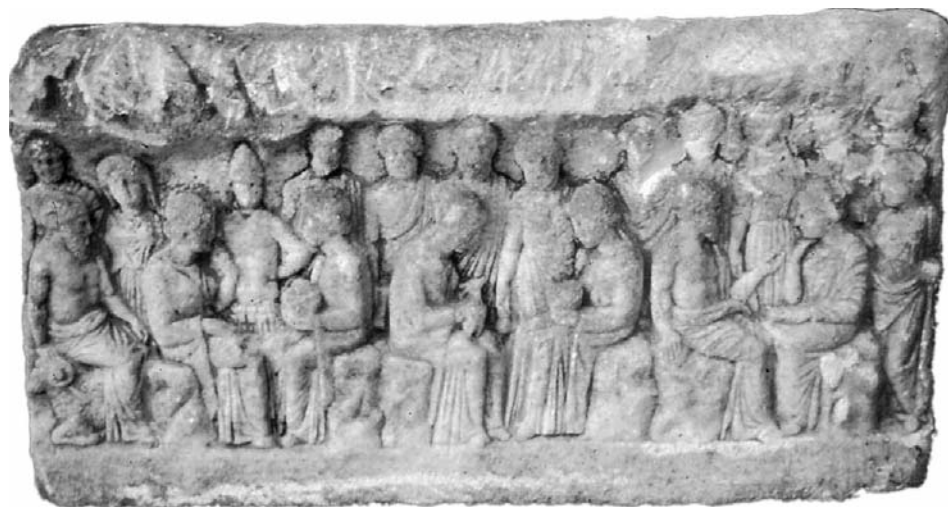
Cyrène. Musée. Bas-relief avec des divinités libyques provenant des environs de Cyrène.

Il est une part très originale dans la sculpture cyrénéenne, celle qui unit les formes grecques aux influences libyques. Il s'agit d'abord d'une riche série de reliefs en marbre, provenant des environs de Cyrène et qui, aux IV e et III e siècles av. J.-C., présentent les divinités libyques, dans une grotte dont le plafond est orné du char du Soleil, et de figures de bovins et de gazelles, ce qui est clairement un trait d'influence locale. Ces divinités sont parfois identifiables, comme Zeus Ammon, cornu et barbu, assis sur son bélier. Il y a aussi Démé-