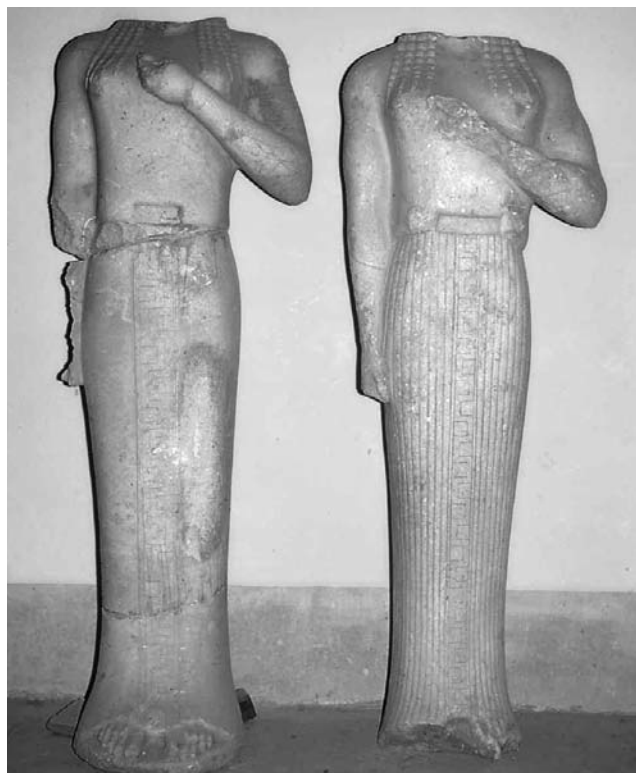
Cyrène. Musée. Korés archaïques du type de Samos.