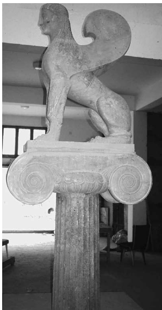
Cyrène. Musée. Sphinx archaïque.

relations avec Athènes, à date haute bien que, comme on le sait, les colons de Cyrène soient originaires de pays doriens, l'île de Théra en mer Égée (la patrie du fondateur Battos), Rhodes, le Péloponnèse et la Crète. On remarque notamment deux très belles korés des années 560, dans le style de celles de Samos, qu'accompagne un kouros , trois œuvres provenant d'une découverte fortuite, sans doute une favissa , ou dépôt sacré, fait pour des statues mutilées par les Perses lors d'une expédition punitive conduite sur l'ordre du satrape d'Égypte en 514, et qui campa dans les environs de Cyrène avant d'aller châtier la ville de Barca, coupable d'insoumission. Il y avait encore dans le même dépôt un splendide sphinx sur une colonne ionique, qui évoque une œuvre similaire de Samos. Or, nous