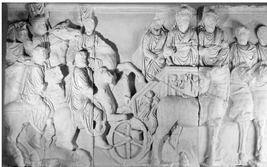
Tripoli. Musée. Haut-relief du triomphe de Septime Sévère (provient de l'arc sévérien de Leptis Magna).

Leptis Magna fut surtout le lieu de naissance de l'empereur Septime Sévère (146-211 apr. J.-C.) qui eut à cœur de la doter de monuments splendides, dignes de Rome : un arc monumental, mais surtout un nouveau forum avec une basilique judiciaire, et une voie à colonnes débouchant sur le port rénové et agrandi. Le raffinement de l'architecture et la qualité de la sculpture, typique de la tendance dite du « baroque africain », sont clairement