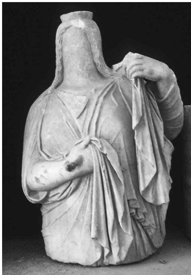
Cyrène. Musée. Demi-statue funéraire aniconique.

emprunte à la Déméter de Praxitèle. Cette série est inaugurée au VI e siècle par des figures aniconiques, à Cyrène mais aussi à Barca (œuvres conservées aujourd'hui au musée de Tolmeta), elle se poursuit durant l'époque classique et hellénistique et durant le I er siècle de l'Empire romain, avec des œuvres tant iconiques qu'aniconiques. L'interruption se fait lors de la révolte juive de 115-117 ap. J.-C. À partir de ce moment, c'est la disparition des grandes figures qui ornaient par centaines les tombes des nécropoles de la région (il y en a aussi à Apollonia et dans les environs). Durant la période