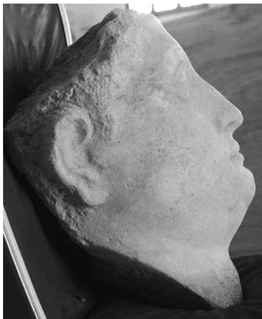
Cyrène. Musée. Acrolithe de Ptolémée III retrouvé dans le port d'Apollonia.

À la fin du VI e siècle av. J.-C., deux belles korés retrouvées dans le sanctuaire d'Apollon sont des parallèles des statues retrouvées à Athènes sur l'Acropole et qui datent du dernier quart du VI e siècle av. J.-C. La période classique n'est pas moins riche, avec une copie de belle qualité d'une tête d'Athéna dans le style de Phidias, ou encore un intéressant bas-relief représentant une scène médicale. L'époque hellénistique nous vaut des chefs-d'œuvre : des portraits royaux des Lagides, maîtres d'Alexandrie, mais aussi d'une large part de la Méditerranée orientale en plus de la vallée du Nil. La Mission française a retrouvé sous la mer, à Apollonia, une superbe tête du roi Ptolémée III