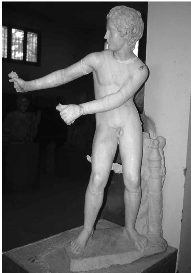
Cyrène. Musée. Éros tendant son arc (époque hellénistique).

(246-222 av. J.-C.), le plus beau portrait de ce roi, un acrolithe plus grand que nature et placé sur une armature de bois et de stuc qui devait avoisiner les 4 mètres de hauteur. Des œuvres plus variées comportent aussi un bien un Éros tendant son arc : cette copie est de très haute qualité et démontre non seulement le goût très sûr des Cyrénéens, mais aussi leur aisance financière. Cyrène avait des sculpteurs, et J. Marcadé a identifié à Délos la signature du sculpteur cyrénéen Polianthès au II e siècle av. J.-C.