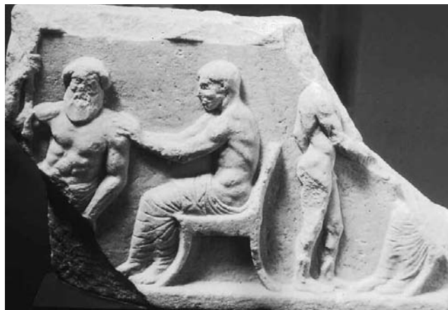
Cyrène. Musée. Bas-relief à sujet médical (fin du V e siècle av. J.-C.).